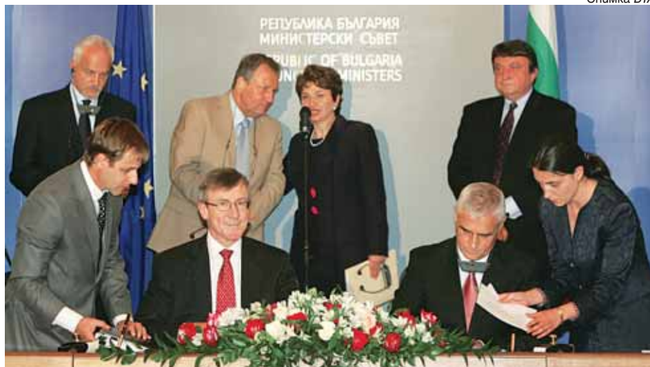
Министърът на икономиката и енергетиката Петър Димитров и Ричард Пели, главен изпълнителен директор на Европейския инвестиционен фонд, погрипват договора, който осигурява кредитен ресурс на бизнеса

Споразумението ще осигури кредитен ресурс за близо 400 млн. лева (200 млн. евро) на българския бизнес. След като правителството предостави 500 млн. лева за бизнеса чрез Българската банка за развитие, това на практика е втората най-важна антикризисна мярка, която ще осигури достъпни условия за кредитиране. Споразумението е резултат от сложни преговори, които българската страна води в продължение на повече от една година. Проведени са консултации с ръководството на Народното събрание, за да може в