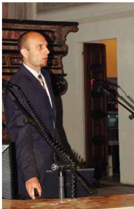
С научен доклад от университета в Торонто

На 23 май беше организирано културно мероприятие, включващо посещение на храма на Викофорте, който има голямо историческо, архитектурно и строително значение. Националният монумент се намира в сеизмична зона и е изключително впечатляващ със своя зиган елиптичен купол, който е най-големият в света (вътрешни размери 37 на 25 м).