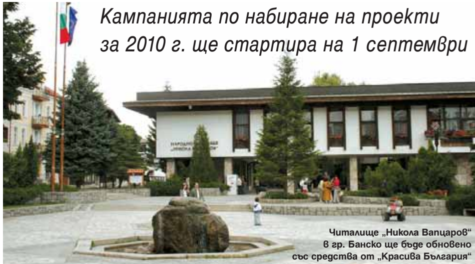
Читалище „Никола Вапцаров“ в гр. Банско ще бъде обновено със средства от „Красива България“

Кампанията по набиране на проекти за 2010 г. ще стартира на 1 септември