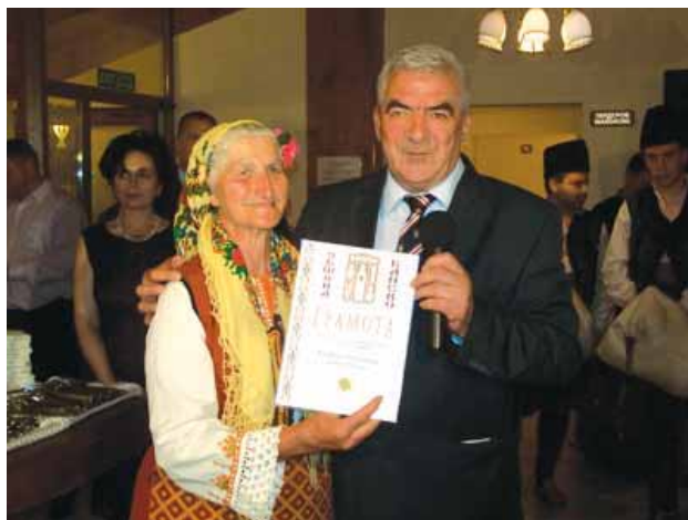
Кметът на града награждава пенсионерите от клуб „Рагон Тодев“ за активно участие във всички общински мероприятия. Възрастните хора са слабост на градоначалника

Независимо от финансовата криза изграждането на нови обекти продължава. Официално в общината не е постъпило уведомление за замразяването на нито един строеж. Кризата се усеща от