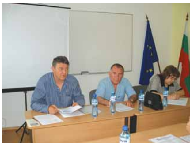
Ръководството на ОП на КСБ – Габрово, отчита дейността си

Общото събрание на областното представителство на КСБ задължи ръководството си да направи предложение до цен-