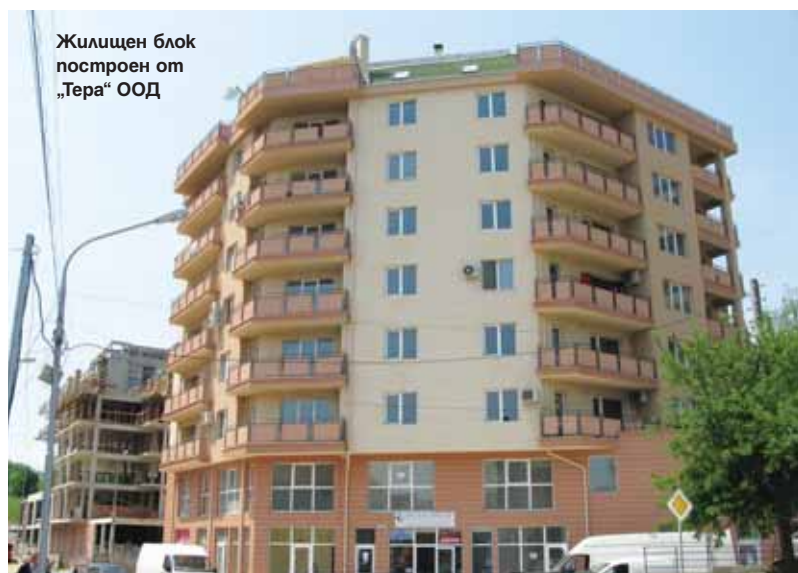
Жилищен блок построен от „Тера“ ООД

складираме материалите си. Тази инвестиция ще струва около два милиона и половина евро. На този етап чакаме оформянето на документите. Базата ще се намира на входа на Търново и ще има 12 хил. кв. м разгъната площ. Тук вече ни е много тясно, нуждаем се от разширение“, споделя Петков.