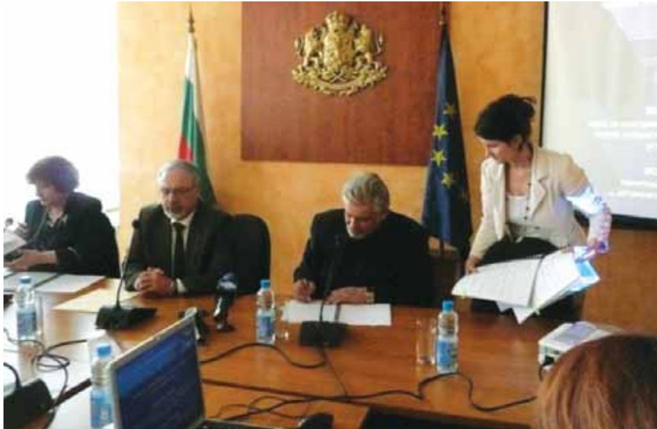
Подписването на рамковите споразумения се състоя в зала „Пресцентър“ на Министерството на регионалното развитие и благоустройството

50 млн. лв. за ремонт на сгради и паметници ще получи Министерството на културата от Оперативна програма „Регионално развитие 2007-2013 г.“. Министър Стефан Данаилов подписа рамково споразумение за безвъзмездна финансова помощ, което се реализира с подкрепата на Европейския съюз. Ще се финансират дейности за подобряване на инфраструктурата на сгради на културни институции държавна собственост, управлявани от Министерството на култура-