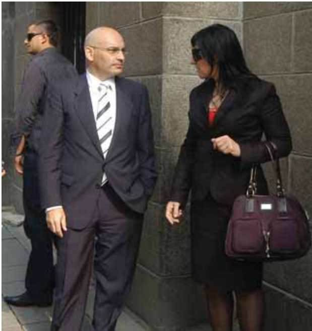
years of efforts, letters and invitations to the famous magistrate to visit our country up to now when the number 1