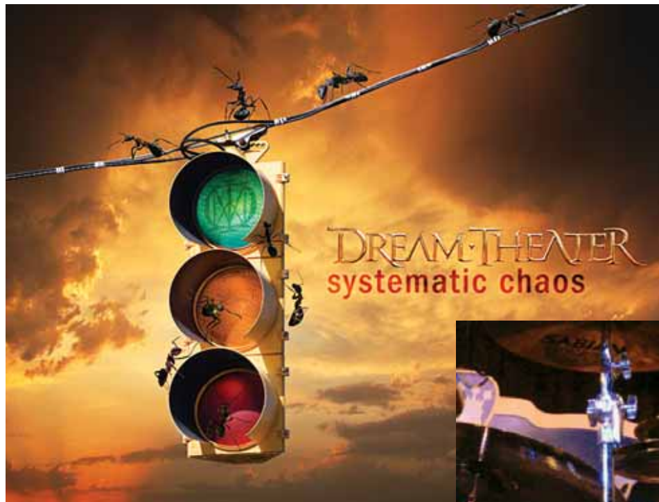
Емблематичният Mike Portnoy от Dream Theater,

който ще свири на българска сцена на 3 юли на Калиакра рок фест '09, е решил да се премени в екип на Националния отбор по футбол на България. Забележителният барабанист, който се