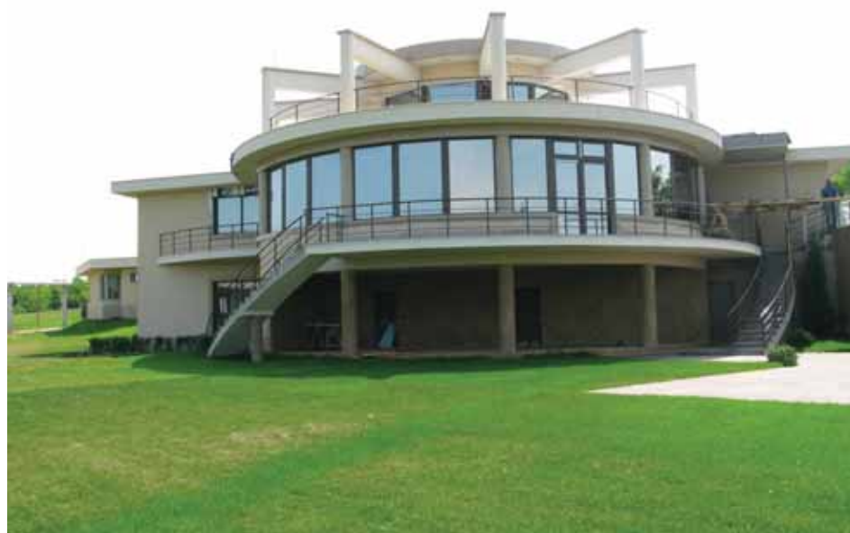
Изграденото от фирма „Тера“ ООД вилно селище в с. Малък чифлик

и въпреки кризата тук се отчита ръст на туризма, при това целогодишно. Има силно развита лека промишленост. В последните години бум бележи вафленото производство“, разказва мениджърът.