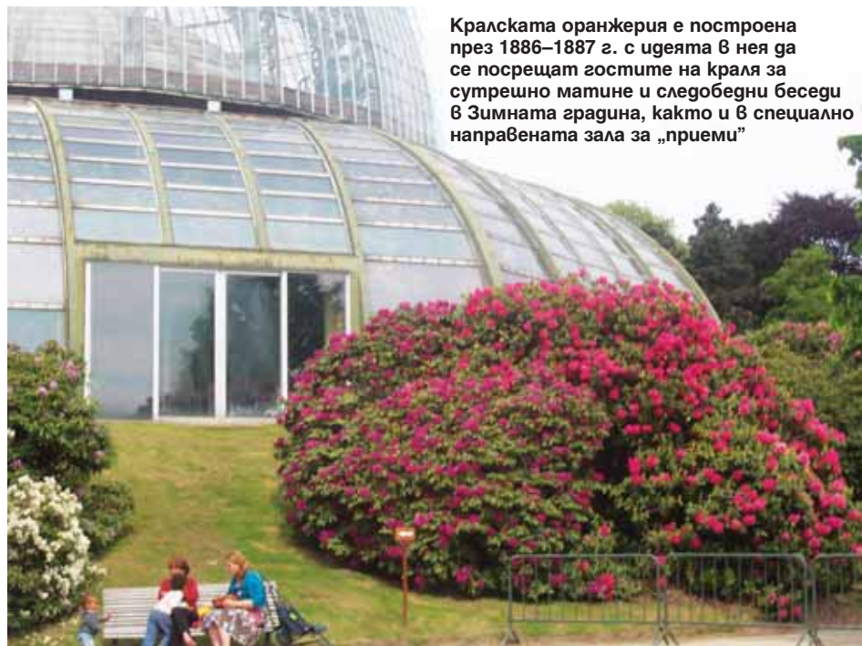
Кралската оранжерия е построена през 1886–1887 г. с идеята в нея да се посрещат гостите на краля за сутрешно матине и следобедни беседи в Зимната градина, както и в специално направената зала за „приеми“

През 1873 г. архитектът Алфонс Балат изгражда за крал Леополд II комплекс от оранжерии,