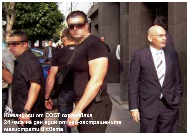
Командоси от СОБТ охраняваха 24 часа на ден един от най-застрашените магистрати в света