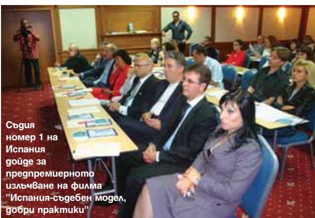
Съдия номер 1 на Испания гоиде за предпремиерното излъчване на филма „Испания-съдебен модел, добри практики“

„Испания - съдебен модел - добри практики“ в град Луксовит, организиран от клуб „Журналисти срещу коруп-