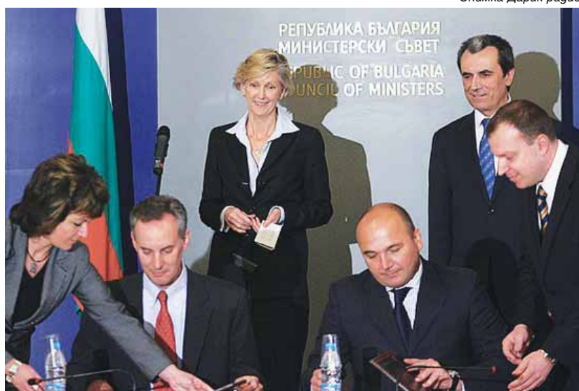
Посланикът на САЩ Нанси Макълдауни и министър Орешарски (прав до нея) са щастливи от подписването на договора

Българското правителство и IBM (NYSE:IBM) официално обявиха сътрудничеството си в областта на нанотехнологиите, както и за изграждането на първия в България център за нанотехнологии. В Министерския съвет бе подписано Общо рамково споразумение, което задава основните параметри на партньорството. Документът предвижда сътрудничество в рамките на 3-годишна програма. Според търговското споразумение консултантите от IBM ще участват в изграждането на новия център, който ще разчита на най-модерно оборудване и ще използва най-новите постижения на нанонауката, за да създава и прилага на практика иновативни високотехнологични продукти. IBM Blue Gene, българският суперкомпютър, собственост на ДАИТС, ще подпомага центъра с изчислителна мощ при реализирането на конкретните разработки. „Вярвам, че реализацията на подобни проекти от сферата на високи-