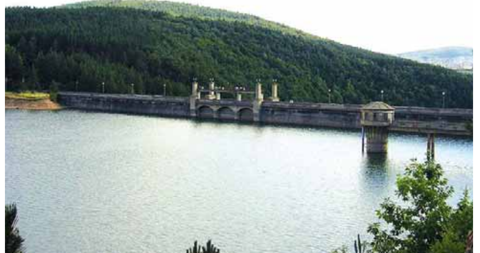
Част от заема ще бъде вложена в рехабилитацията на яз. „Студена“

Схемите за безвъзмездна финансова помощ се реализират с финансовата подкрепа на Европейския съюз чрез Европейския фонд за регионално развитие.