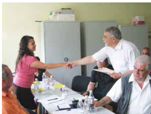
Арх. Моллов връчва удостоверения на участниците в обучението

Вторият семинар се състоя през февруари и март 2009 г. Този път обаче курсът на обучение преминава представителите на трите основни групи участници в инвестици-