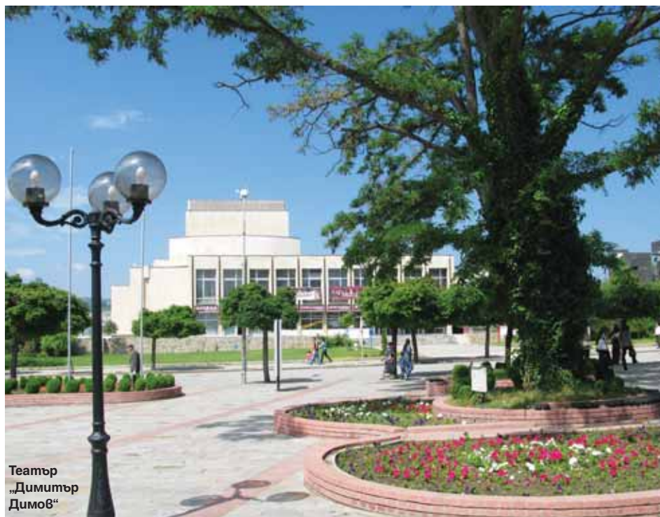
Театър „Димитър Димов“

ното в него е покривната конструкция, напомняща елементи от големите европейски стадиони, изработена от съвременни поликарбонатни материали. Към нов живот бе върнат един от старите символи на града – детската железница, открита в далечната 1962 г. След близо осемгодишно прекъсване, в началото на август миналата година,