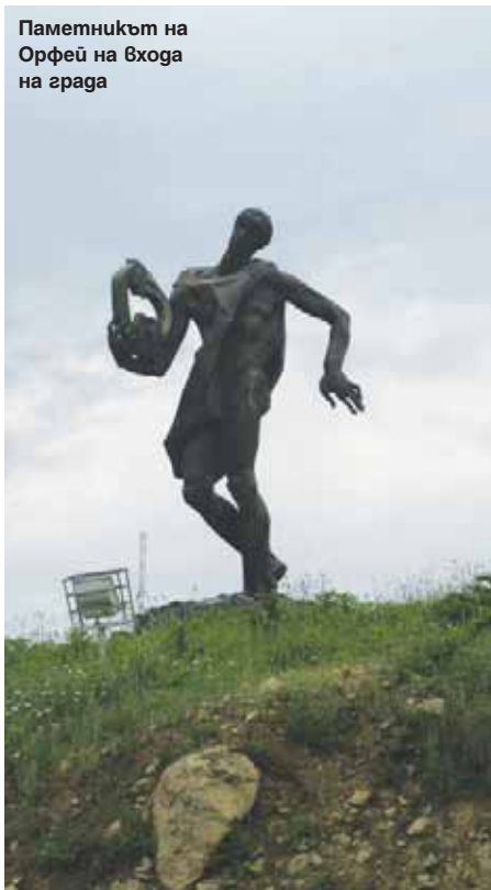
Паметникът на Орфей на входа на града

ното в него е покривната конструкция, напомняща елементи от големите европейски стадиони, изработена от съвременни поликарбонатни материали. Към нов живот бе върнат един от старите символи на града – детската железница, открита в далечната 1962 г. След близо осемгодишно прекъсване, в началото на август миналата година,