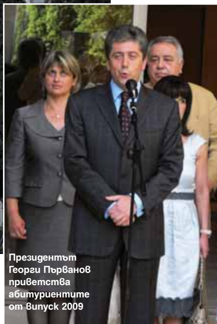
Президентът Георги Първанов приветства абитуриентите от випуск 2009

През годините повече от 3500 младежи, лишени от родителска грижа, са имали своя