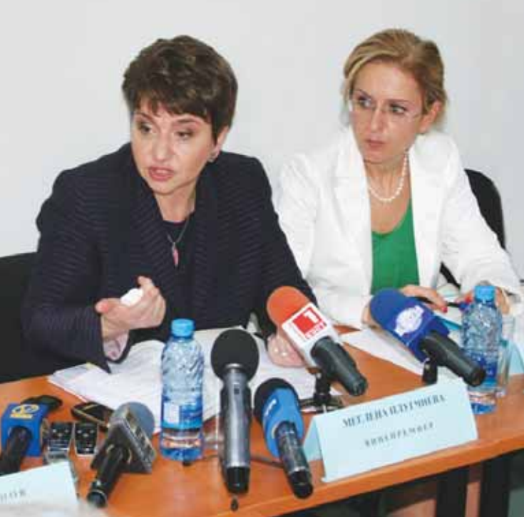
Меглена Плугчиева - вицепремиер и Боряна Пенчева от Министерството на финансите

на управление трябва да бъде така променен, че процесът да може да тече много по-бързо. Тя смята, че е необходимо част от пълномощията да бъдат свалени на долу, по места, защото тази централизация в София прави лошо впечатление в Брюксел. „Ние се различаваме от всички други страни членки в това отношение. Хората по места реално не могат да участват в процеса“, изтъкна вицепремиерът и подчерта, че такава е практиката в повечето европейски страни, като посочи за пример Австрия. Според нея трябва да се наблегне