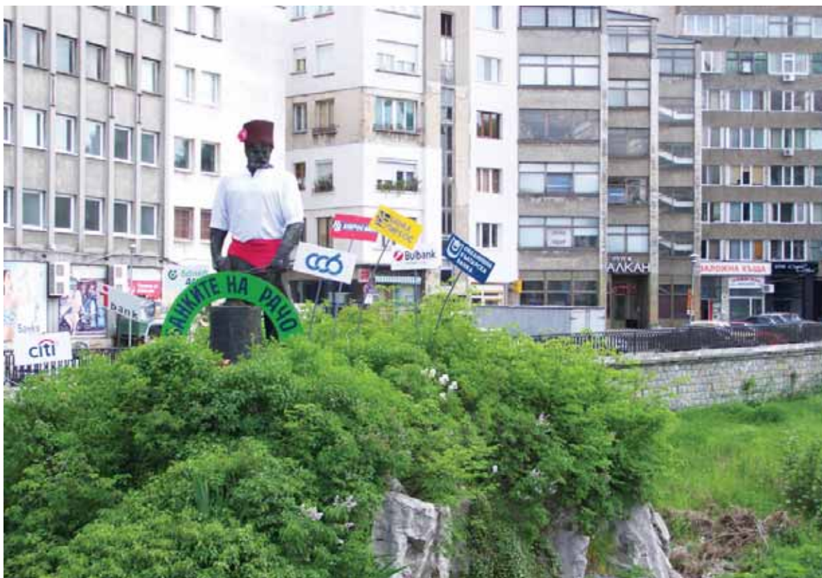
Всяка година габровци обличат Рачо с различни одежди. Това лято той бе пременен като banker, който раздава кредити направо от реката

Днес Габрово, който се слави и с прословутото си чувство за хумор и деликатна пресметливост, пази ревниво величавото си минало. И го награжда с вестината на модерния човек, който знае, че да се строи, означава да се пише история... И че няма по-сигурен начин да оставиш следа от това да изградиш черква, да построиш дом, да разшириш пътя. А всичко това е невъзможно без строителите. Затова няма нищо чудно, че в ОП-Габрово са регистрирани 85 строителни фирми, въпреки че жилищните сгради в града са отдавна построени и за хората от бранша остава основно да награждат в обществената инфраструктура.