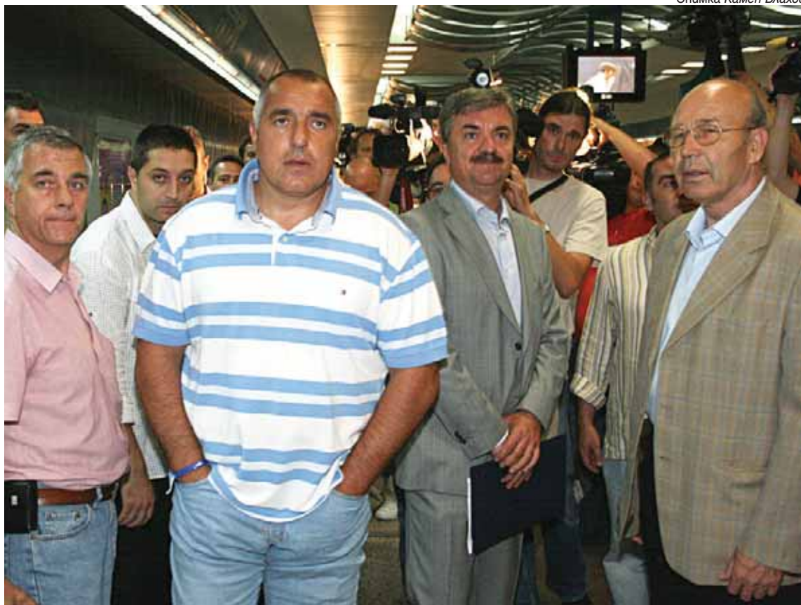
Кметът на София Бойко Борисов показва на журналисти новото трасе на метрото между станциите „Стадион „Васил Левски“ и „Сердика“. До него е председателят на КСБ инж. Симеон Пешов