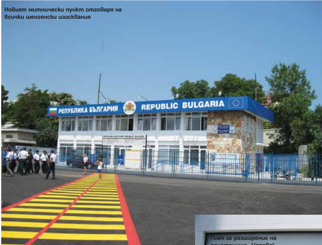
Новият митнически пункт отговаря на всички шенгенски изисквания