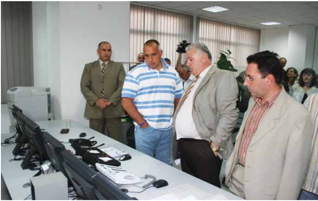
The Mayor of Sofia Boyko Borisov promised that the route between the "Stadium Vasil Levski" and "Serdika" subways would be finalized by September 15

The dispatch centre, located in the Metropolitan Building on Todor Aleksandrov Boulevard,