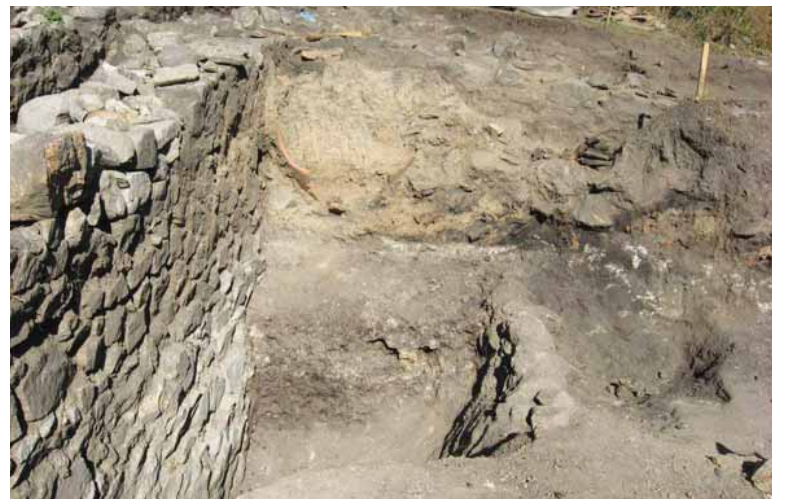
Следите от огромен пожар на места са с дебелина до половин метър

„Най-забележителното място в местността е откритото тракийско светилище с изсечени в скалата стъпала към мястото на главния жрец. Там, на най-високата точка, той е извършвал ритуала, обграден от помощниците и цялото население. Открихме много съдове, които са били принасяни като жертвоприношение. За да не се убиват животни, траките са принасяли в жертва съдове с пробити гъна. Светилището е и най-стра-