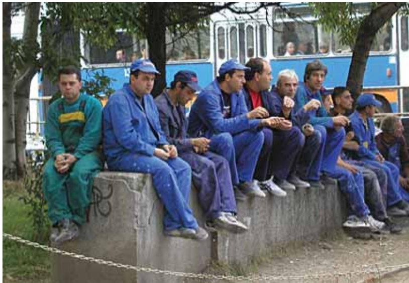
Некоректните работодатели убиват ентузиазма на работниците

Според информацията от провела се между пред-