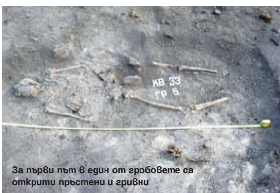
За първи път в един от гробовете са открити пръстени и гривни

и благоприятни за датироването на обекта. От монетите става ясно, че те са от III до VII в. При разкриването на южната стена има прекъсване, в което се намират фрагменти от праисторическа керамика. Откритите съдчета са от края на бронзовата и началото на желязната епоха. Това връща поселищния живот с още две хиляди години назад. Стигнато е до източната крепостна среда на вътрешния град и стражевата кула на вътрешния град. Битовите предмети и оръдията на труда, които излизат, достатъчно красноречиво говорят, че селището е било много напред в икономически аспект. И