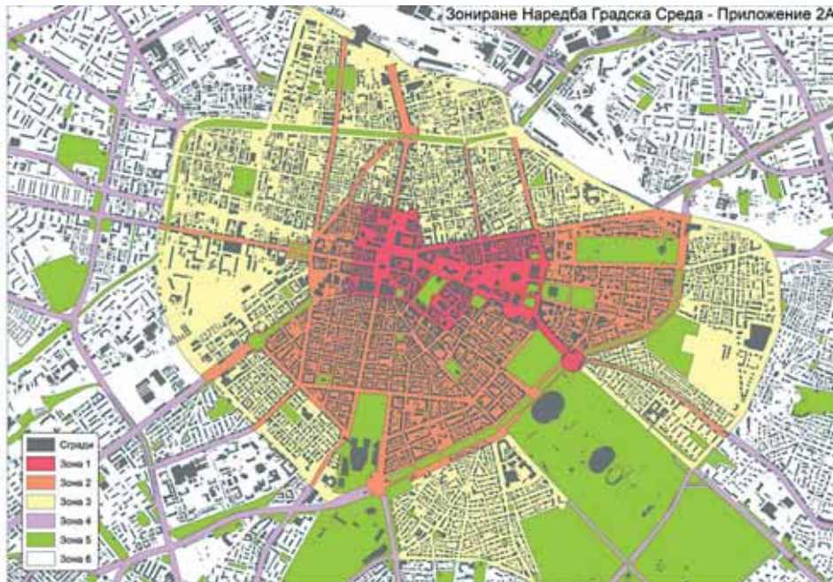
София ще бъде разделена на 6 части, в които ще действат различни правила за визията на градската среда

Предстои да бъде решено и с какъв срок ще разполагат собствениците на имоти, за да приведат домовете си съгласно новите изисквания на бъдещия нормативен акт. Заложено е кметът на Столичната община или упълномощени от него лица да извършват контрол за спазване на разпоредбите. При проверките от тяхна страна може да се изискват определени документи, да се привличат допълнителни експерти, както и да се съставят актове. За нарушения на вишните лица ще се налага глоба в размер от 200 до 500 лв., а