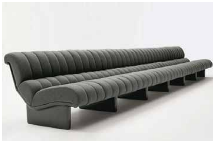
Диванът Lombrico, B&B Italia, 1967. Тук италианецът преди всички вижда идеята за модулността, която доминира и на последното издание на Миланската седмица на дизайна. Бил е предназначен за обществени места

От 1955 до 1957 г. Марко Дзанузо работи като архитект в компанията Olivetti, проектирайки заводи в Сао Пауло и Буенос Айрес. По-късно той се обединява с Ричард Запър, млад талантлив немски дизайнер, който живее в Милано. С него Дзанузо работи заедно до 1977 г. Двамата създават стола Lambda за Gavina, телефона Grillo за Siemens, кухненски везни за френската фабрика Terraillon и голямо разнообразие от домакински уреди за