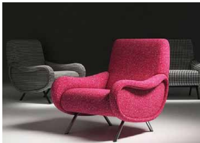
Креслото Lady, 1951

Съставен от модули от фибростъкло със седалка от гума, той прилича на гигантска гъсеница и е произведен от B & B Italia. Този модел най-добре изразява идеята за модулността за онова време, която тепърва ще се развива. Бил е предназначен за обществени места.