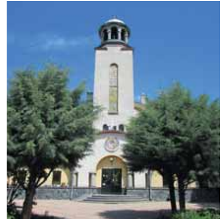
Храм „Св. Троица“