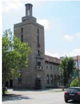
Старото читалище на „Слатина“

Най-големият проект на СО тази година е реконструкцията на ул. „Николай Коперник“. Тя е една от шестте най-големи улици в района, преминава през два квартала и стига до едно от ембле-