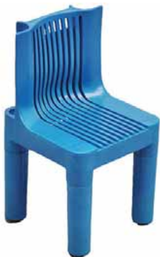
Детският стол „4999“, произведен от Kartell през 1964 г.

Bionvega. Изобщо двойката проектирала дизайна на продуктите на иновативната за времето си италианска електроника като отговор, като контрапункт на това, което се създадо в Германия и Япония.