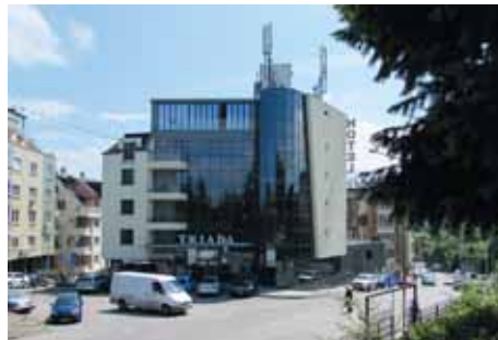
Строителството на жилищни и офис сгради продължава

матичните места в столицата - хотел „Плиска“, което е възлово в транспортно отношение за цяла София. Иначе, що се касае до тротоари и други по-малки строителни дейности, имаме определени програми, които изпълняваме. Тротоарите са бонна тема за столицата, защото те много често са своеобразни паркинги за колиите на жителите и гостите на града. Търсят