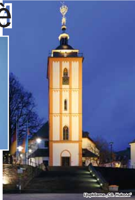
Църквата „Св. Никола“

слухове“ тук е роден Петер Паул Рубенс. Оказва се обаче, че това е просто шега, защото родната къща на Рубенс – „Къщата на Брамбах“, която бащата на художника е наел в Зиген за себе си и семейството си, е била на „Бусшрасе“ 10 и е напълно разрушена през последните седмици на Втората световна война. Това, разбира се, не пречи на хилядите туристи да снимат самозвания дом на художника.