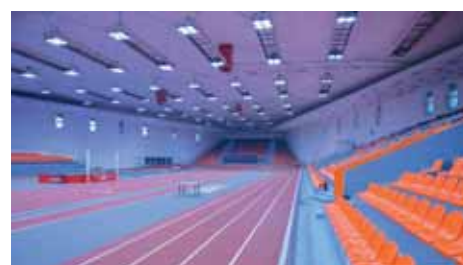
Зала „Фестивална“ след реконструкцията