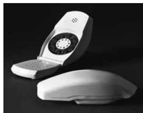
Телефонът Grillo за Siemens. 1966

ка, който се превръща в дневна. Тогава се появява и диванът Lombrico - един от най-популярните модели на 70-те години.