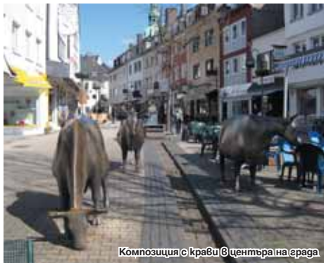
Композиция с крави в центъра на града

За първи път селището е споменато в исторически документи от XI век. През Средновековието постепенно се превръща във влиятелен център на обществения, политически и културен живот в Германия. През 1224 г. архиепископът на Кьолн назначава за негов управител