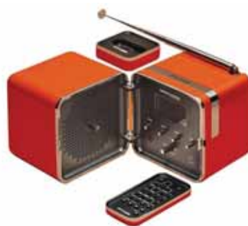
Преносимото радио TS-502, проектирано заедно с Ричард Запър за компанията Bionvega. 1963

Сред успехите на дуото Запър - Дзанузо е детският стол „4999“, произведен от Kartell през 1964 г. Той е яркосин с подвижни цилиндрични крака и оребрени седалка и гръб, с което се постига намаляване на тежлото при запазване на стабилността. Това е първият изцяло направен с пластмасово шприцоване предмет за бита.