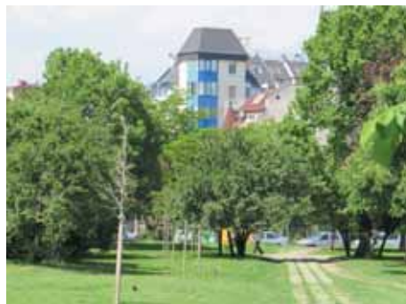
Парк „Гео Милев“