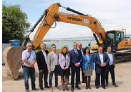
Направена беше и първа копка на изграждането на рибарско пристанище в местността Карантината в район „Аспарухово“

Направена беше и първа копка на изграждането на рибарско пристанище в местността Карантината в район „Аспарухово“. Проектът се финансира по „Програма за морско дело и рибарство“ чрез Европейския фонд за морско дело и рибарство и е на обща стойност 13,7 млн. лв.,