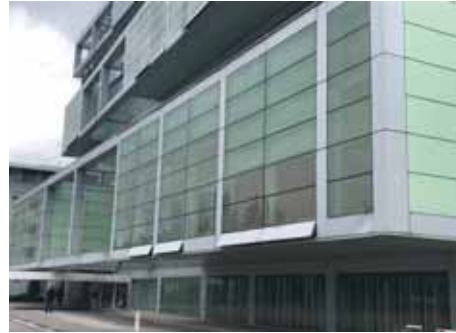
Дигитализацията е необходимост и неизбежна на развитието на новото време“

е нещо, което във FIEC е един от приоритетите и моето желание е да стане приоритет и в България, а защо не и във всички държави от ЦИЕ. Във FIEC има специално създадена група – Construction 4.0., която се занимава с проблемите и въвеждането на дигитализацията“, допълни инж. Качамаков и посочи, че за него е важно да се информира за нивото на дигитализацията във всичките