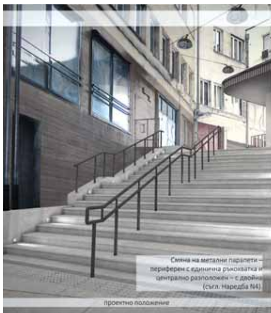
Снимка на метални парапети – периферен с единична ръкохватка и централно разположен – с двойна (Съгл. Наредба №4)

Сградите от срещуположната страна на двора са засегнати много силно от бомбардировките. Те са разрушени в началото на 50-те години, когато е издигнат Партийният дом. Премахнати са фонтанът, който се е намирал там, както и част от сервизните помещения на Царския дворец, а през двора му е прекарано прогледжението на бул. „Цар Освободител“. Това е период, в който са направени опити ул. „Малко Търново“ да бъде заличена във връзка с идеята за цялостно преустройство на района в партийно-политически център на страната. Пространството пред най-късата пешеходна улица в София е с ново предназначение – има политическа роля и е прекръстено на пл. „9 септември“. В едно от зданията се помещава Народната милиция. През 70-те години пък във връзка с разширяване на службите на ЦК на БКП вземте сгради на входа на улчицата са придобити към Партийния дом, като е изградена топла връзка между тях. А бар „Луна“ официално прекратява дейността си.