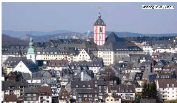
Изглед към Зиген

То представлява неизползваема сферична конструкция, разположена в