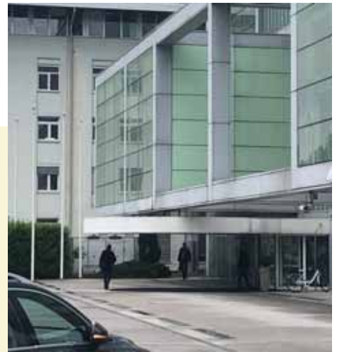
Снимки в „Строител“